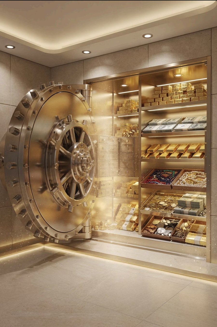
Illustration 1: „Bank des Universums“

Genug für alle – aber nicht automatisch auf Deinem Konto